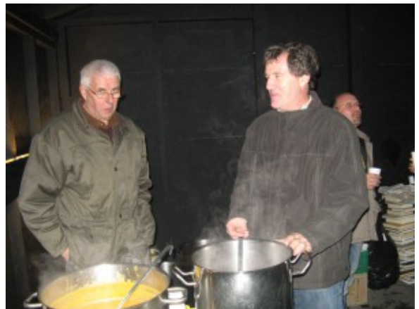
Personnel de Botza servant de la soupe et du vin chaud.

Réalisée par le Centre de formation pour requérants d'asile du Botza, elle présente la Nativité du Christ d'une manière saisissante, grâce à des personnages entièrement réalisés avec du papier journal et d'anciens livres recyclés. Plus d'un millier d'ouvrages ont été nécessaires à sa réalisation.