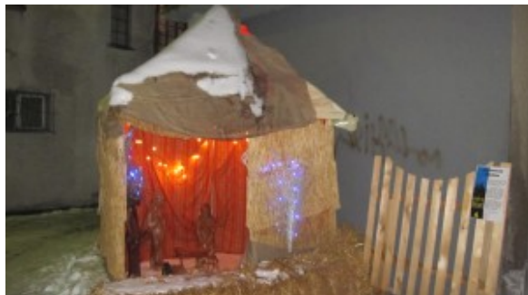
Crèche construite par la communauté togolaise de Sion.

Pour célébrer Noël et entrer en beauté dans la nouvelle année, Sion brille de mille et une crèches construites par des membres des communautés étrangères qui y vivent, ainsi que par des ressortissants suisses. Voix d'Exils vous emmène à la découverte de quelques-unes de ces œuvres, symboles de la diversité culturelle de la capitale valaisanne.