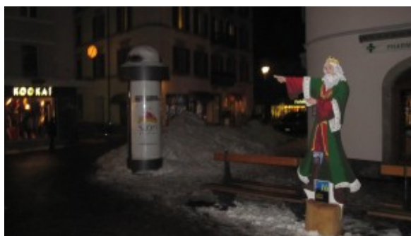
Les Rois Mages.

Pour célébrer Noël et entrer en beauté dans la nouvelle année, Sion brille de mille et une crèches construites par des membres des communautés étrangères qui y vivent, ainsi que par des ressortissants suisses. Voix d'Exils vous emmène à la découverte de quelques-unes de ces œuvres, symboles de la diversité culturelle de la capitale valaisanne.