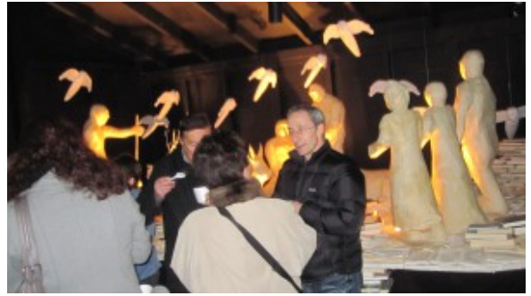
Crèche Botza.

Réalisée par le Centre de formation pour requérants d'asile du Botza, elle présente la Nativité du Christ d'une manière saisissante, grâce à des personnages entièrement réalisés avec du papier journal et d'anciens livres recyclés. Plus d'un millier d'ouvrages ont été nécessaires à sa réalisation.