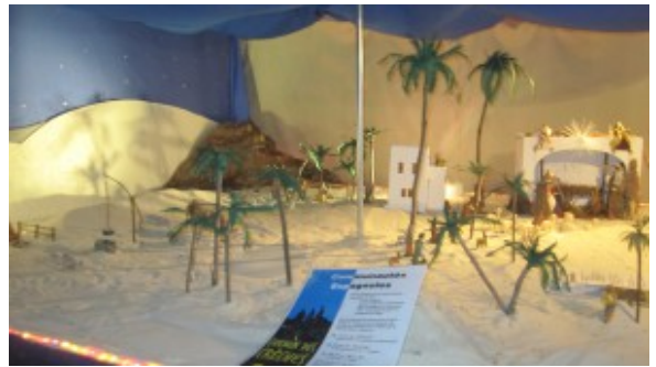
Crèche espagnole.

Alliant simplicité et originalité, la communauté togolaise présente, dans un coin de la place Jules Verne, une crèche montrant des statues taillées dans du bois typique de ce territoire de la côte ouest africaine.