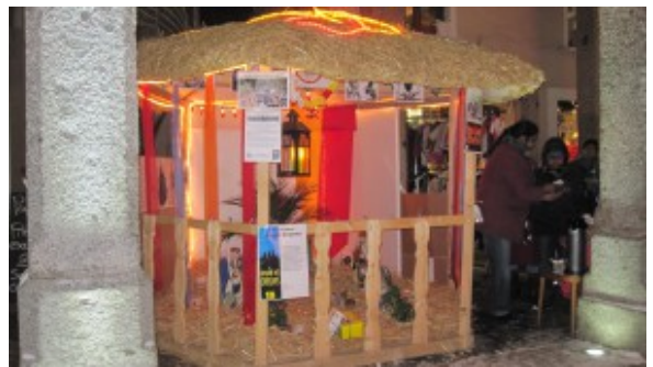
Crèche sri-lankaise.

Un peu plus loin, sous les arcades de la Grenette, il est difficile de rester insensible devant la crèche de la communauté sri-lankaise, qui ne fige pas la scène de la Nativité dans un passé lointain mais, au contraire, au milieu des déchirements d'aujourd'hui.