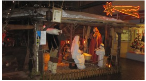
Crèche italienne.

La communauté italienne n'a pas manqué à l'appel, en exposant une crèche dont l'originalité est à la hauteur de sa tradition hautement chrétienne.