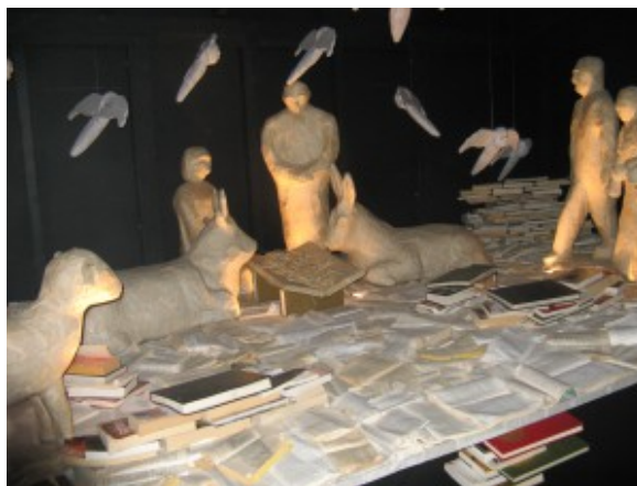
Crèche Botza.

Ce sont des rois mages joliment faits de bois qui guident, tout doucement, le visiteur engagé à découvrir les merveilles des vingt-et-une crèches situées sur les hauteurs de la vieille ville à Sion.