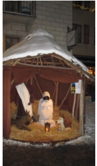
Crèche érythréenne.

De leur côté, en représentant Joseph et Marie comme ressortissants de l'Afrique noire, les érythréens osent bousculer des idées reçues. Leur communauté, forte en Valais de quelques 300 personnes issues de différentes cultures, se retrouve traditionnellement lors des rencontres festives comme Noël et Nouvel An.