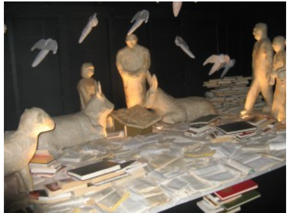
Crèche Botza.

Ce sont des rois mages joliment faits de bois qui guident, tout doucement, le visiteur engagé à découvrir les merveilles des vingt-et-une crèches situées sur les hauteurs de la vieille ville à Sion.