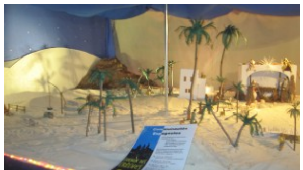
Crèche espagnole.

Alliant simplicité et originalité, la communauté togolaise présente, dans un coin de la place Jules Verne, une crèche montrant des statues taillées dans du bois typique de ce territoire de la côte ouest africaine.