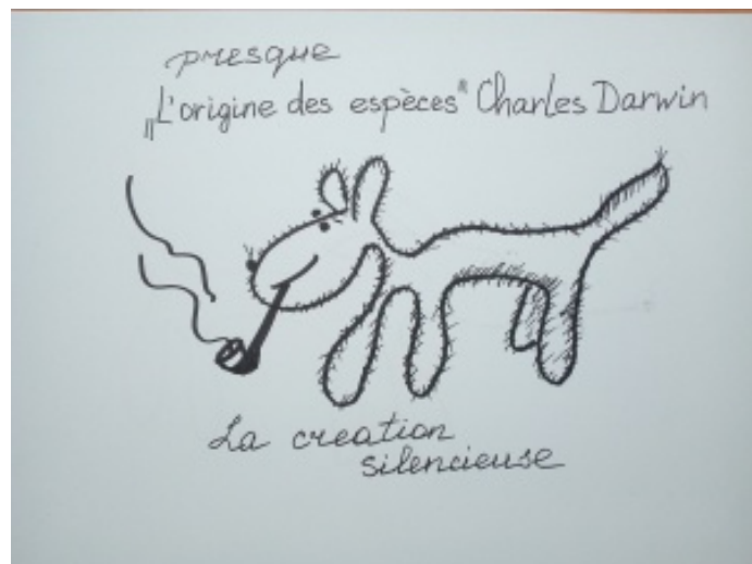
Auteure: Madame Etrangère