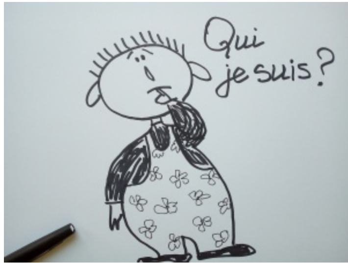
Auteure: Madame Etrangère